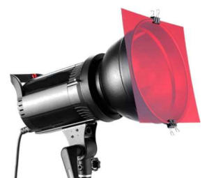
Un projecteur équipé d'un filtre gélatine