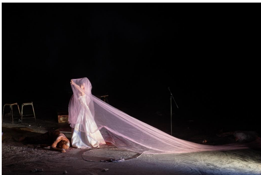
L'ORGANISATION – atelier de creation