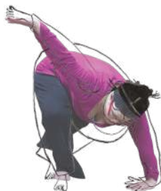
ILLUSTRATION © À CIEL OUVERT

Porté par une belle énergie de groupe, le spectacle célèbre la joie de créer à plusieurs et déplace notre regard sur le handicap. Ici, il n'est pas question d'assigner, mais d'ouvrir : à d'autres écritures, à d'autres sensibilités, à d'autres façons d'être ensemble. Une danse vive, libre et profondément humaine, traversée d'émotion.