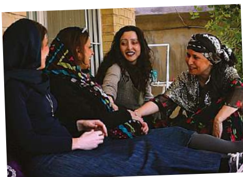
No Land's Song