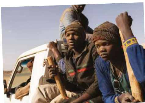
Moi Capitaine !