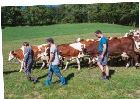
La ferme des Bertrand

Le cinéma accueille les scolaires dans le cadre de dispositifs maternelles, écoles, collèges, lycéens et apprentis au cinéma.